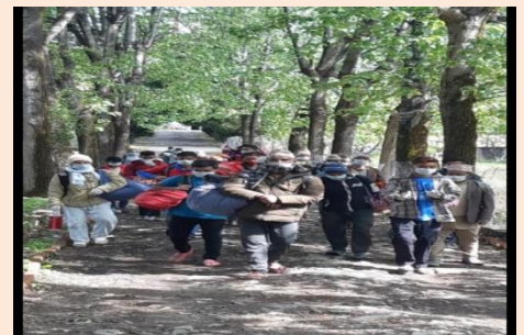
क्वारेन्टाईन सेन्टरबाट फिर्ता हुदै

जिल्ला स्थित क्वारेन्टाईन स्थलहरूमा रहेका व्यक्तिहरूको RDT तथा PCR परीक्षण गर्दा Negative आएका व्यक्तिहरूलाई आवश्यकीय स्वास्थ्य परामर्श सहित घरफिर्ता गरिएको छ । पछिल्लो समय भारतबाट आएका जुम्लाबासीहरूको PCR परीक्षण गर्दा Negative नतिजा आउने क्रम जारी रहेको छ । जुम्लामा हालसम्म १९६६ व्यक्तिहरू क्वारेन्टाईन तथा Isolation मा बस्ने अवधि समाप्त गरी घर फर्कीएका छन् ।