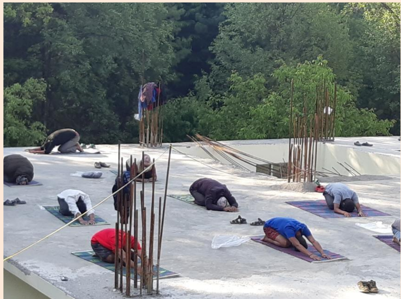
क्वारेन्टानमा रहेकाहरूका व्यक्तिहरू योगाभ्यासमा