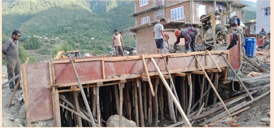
लकडाउनको पालना गर्दै विकास निर्माण कार्य हुदै

लगातारको लकडाउन र आर्थिक वर्षको अन्तिम अवस्था तथा अधुरो रहेका विकास कार्यहरूलाई वर्षात अगावै पुरा गर्नु पर्ने जिम्मेवारी रहेकोले यस दौरानमा विकास निर्माण कार्यलाई CCMC, जुम्लाले सहजीकरण गर्दै आईरहेको छ । केन्द्र सरकार, प्रदेश सरकार तथा स्थानीय सरकारबाट संचालित विकास आयोजनालाई आवश्यक मेसिन/उपकरण, सवारी साधन तथा कामदार आवागमनलाई सहजीकरण गरिएको छ भने आवश्यक निर्माण सामग्रीको ढुवानीका लागि उद्गम स्थल देखि जुम्लासम्म ल्याउन बाटोमा पर्ने सम्पूर्ण जिल्ला प्रशासन कार्यालयसँग समन्वय गर्ने गरिएको छ ।