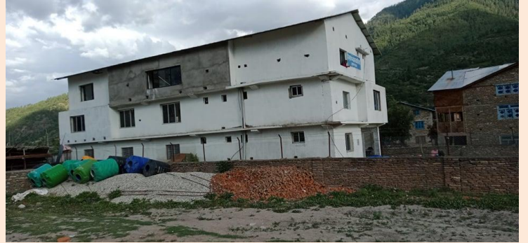
क्वारेन्टाइन स्थलको रूपमा रहेको निर्माण व्यवसायी संघको भवन

नेपाल निर्माण व्यवसायी संघको भवनलाई जिल्ला स्तरीय एकीकृत क्वारेन्टाईन सेन्टरको रूपमा विस्तार गर्ने भनी मिति २०७७/०२/१० गतेको जिल्ला विपद् व्यवस्थापन समितिको निर्णयका विरुद्धमा सो भवन आस पासका समूदायले उच्च अदालत सुर्खेत, जुम्ला ईजलाशमा रिट दायर गर्नु भएको थियो । क्वारेन्टाईन स्थल घना बस्तीको बीचमा रहेको, विपद्