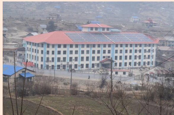
कर्णाली स्वास्थ्य विज्ञान प्रतिष्ठान, जुम्ला

जिल्ला स्तरीय एकीकृत क्वारेन्टाईन सेन्टर कर्णाली प्राविधिक शिक्षालयमा रहनु भएका दोस्रो चरणका २५ जना व्यक्तिहरूको PCR परीक्षण गर्दा २०७७/०२/१९ मा जुम्लामा प्रथम पटक १९ जनामा कोरोना संक्रमण देखिएको थियो । जसमध्ये १६ जना भारतबाट आउनु भएको थियो भने २ जना सुरक्षाकर्मी र १ जना स्वास्थ्य सेवामा खटिनु भएका स्वास्थ्यकर्मी हुनु हुन्थ्यो । तत् पश्चात सो सेन्टरको व्यवस्थापनमा खटिनु भएका सुरक्षाकर्मी, स्वास्थ्यकर्मी, क्यान्टिन संचालक, व्यवस्थापकीय कर्मचारीहरूको PCR परीक्षण गरिएको थियो । यस परीक्षणले थप ७ जना स्वास्थ्यकर्मी, सुरक्षाकर्मी, कर्मचारीहरूमा संक्रमण देखिएको थियो । यसरी संक्रमण देखिएका व्यक्तिहरूलाई कर्णाली स्वास्थ्य विज्ञान प्रतिष्ठानको Isolation कक्षमा राखी उपचारको व्यवस्था मिलाईएको छ ।