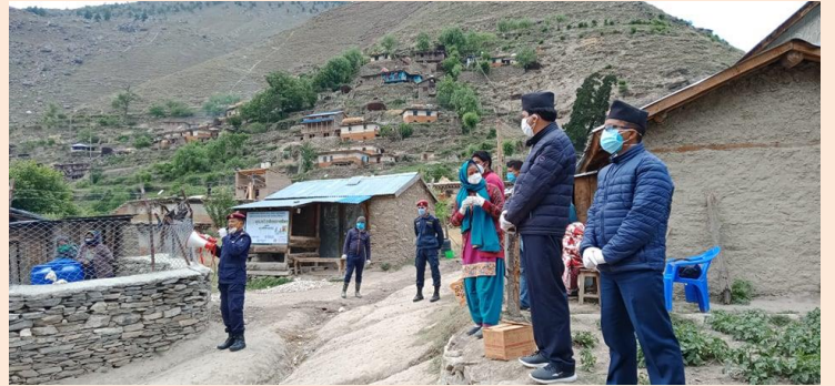
सरस्वती मा.वि. कुडारीमा प्र.जि.अ. सहितको टोली