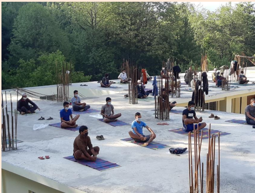
क्वारेन्टानमा रहेकाहरूका व्यक्तिहरू योगाभ्यासमा

उत्पन्न गरेको मानसिक तनावलाई कम गर्न तथा हरेक नागरिकको जीवनलाई अनुशासित बनाउनु सो कार्यक्रमको उद्देश्य रहेको थियो । यसै