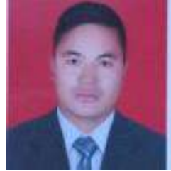
दत्त लामा नायब सुब्बा