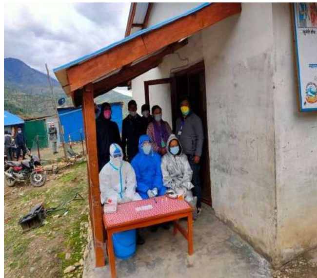
RDT गर्दै स्वास्थ्यकर्मी

२०७६/१२/२५ गते गरिएको Throat Swab संकलनका बखत छुटेका र त्यस पश्चात जिल्लामा प्रवेश गरेका व्यक्तिहरूको जिल्ला जनस्वास्थ्य सेवा कार्यालय, जुम्लाको नेतृत्व तथा CCMC जुम्लाको सहकार्यमा सबै स्थानीय तह अन्तर्गत रहेका प्रत्येक क्वारेन्टाइन स्थलमा पुगी Rapid Diagnostic Test गरिएको थियो । हालसम्म जुम्ला जिल्लामा ५०२ जनाको RDT भएको र सबैको नतिजा Negative रहेको छ ।