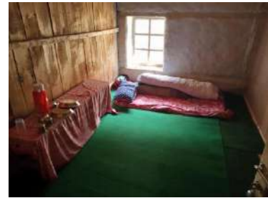
पातारासी गा.पा.को क्वारेन्टाइन

भारत तथा तेस्रो मूलुक र नेपालको विभिन्न स्थानहरूबाट आएका व्यक्तिहरूको लागि स्थापना गरिएका विभिन्न स्थानीय तह अन्तर्गत क्वारेन्टाइन स्थलहरूको COVID-19 Crisis Management Centre, जुम्लाले नियमित रूपमा अनुगमन निरीक्षण गरिरहेको छ । अनुगमनका क्रममा क्वारेन्टाइनमा बसेका व्यक्ति, स्थानीय तहका पदाधिकारी, स्वास्थ्यकर्मी, सुरक्षाकर्मी र अन्य व्यक्तिहरूसँग अन्तर्क्रिया गर्ने गरेको छ । यस क्रममा बाहिरबाट जिल्ला प्रवेश गरेका व्यक्तिहरूलाई क्वारेन्टाइनमा