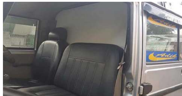
COVID-19 Friendly Ambulance