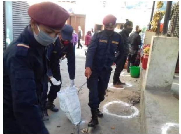
पसलमा सामाजिक दुरी कायम गर्ने घेरा बनाउदै नेपाल प्रहरी