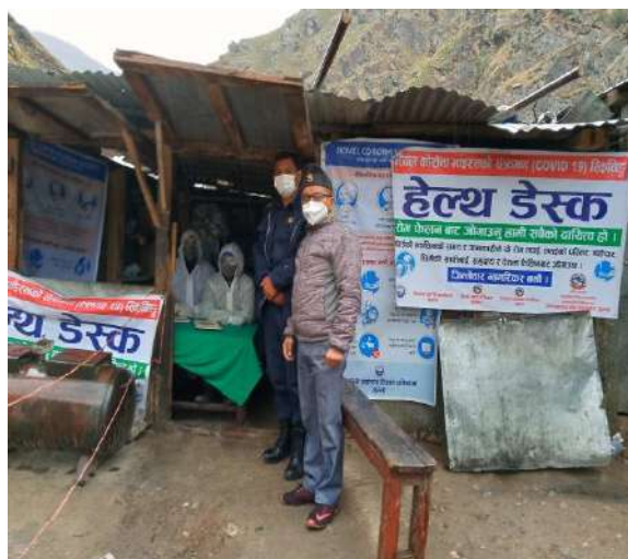
नागम हेल्थ डेस्कको अनुगमन

लकडाउनको आरम्भसँगै COVID-19 को संक्रमणबाट जिल्लालाई सुरक्षित राख्न जिल्ला प्रवेश गर्ने नाकाहरू नागम (जुम्ला - कालिकोट) मणिसाँखु ( जुम्ला - डोल्पा), ताम्ती (जुम्ला - जाजरकोट), गोठिज्यूला (जुम्ला - मुगु) तथा जुम्ला विमानस्थलमा Health Desk को स्थापना गरियो । यसै गरी स्थानीय तहहरूको निर्णय बमोजिम एक स्थानीय तहबाट अर्को स्थानीय तहमा प्रवेश गर्ने नाकामा पनि Health Desk स्थापना गरिएको थियो । त्यस्ता हेल्थ डेस्कहरू जुगाड (हिमा गा.पा.), उमगाड (चन्दननाथ नगरपालिका) तथा उर्थु र डिल्लीचौर (पातारासी गा.पा.) मा रहेका थिए । यी हेल्थडेस्कहरूबाट हालसम्म १२ हजार भन्दा बढी व्यक्तिहरूको स्वास्थ्य परीक्षण गरिएको छ जसमा नागम Health डेस्कको हिस्सा मात्र ९५% भन्दा माथि छ । मिति २०७६/१२/०९ बाट