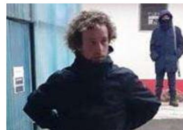
उद्धार क्रममा रहेको जर्मन नागरिक

Lockdown को घोषणासँगै मुगु तथा जुम्ला जिल्ला भ्रमणमा रहेका २३ जना विदेशी नागरिकहरूको उद्धार गरिएको छ । यस्ता विदेशीहरू ६ चाइनिज, ५ भारतीय, ४ इटालियन, १ जर्मन, १ क्यानेडियन, २ अमेरिकन र ४ फ्रान्सेली नागरिक रहेका छन । यस्ता पर्यटकहरूलाई नेपाल पर्यटन बोर्डको अनुरोध तथा गृह मन्त्रालयको निर्देशन बमोजिम उनीहरूको गन्तव्यसम्म पुग्नका लागि यात्रा सहजीकरण गरिएको थियो ।