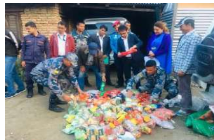
अनुगमन पश्चात अखाध्य बस्तु नस्ट गरिदै