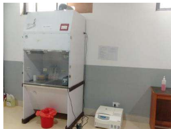
PCR उपकरण जडान

गरिएको छ । मिति २०७७/०१/२२ गतेबाट संचालनमा आएको उक्त उपकरणबाट हालसम्म ५ हजार भन्दा बढी व्यक्तिको Throat Swab परीक्षण गरिएको र सबैको नतिजा Negative रहेको छ । CCMC जुम्ला, स्थानीय तह,