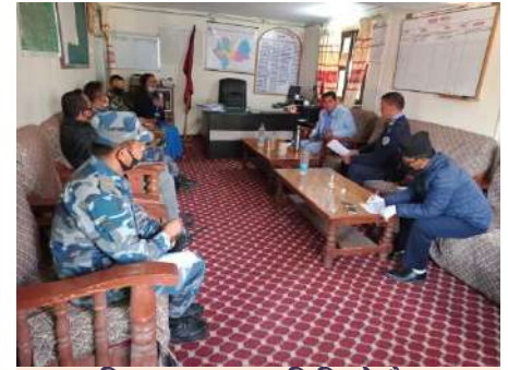
जिल्ला सुरक्षा समितिको बैठक

कोरोना भाइरस COVID-19 को रोकथाम र नियन्त्रणका लागि अपनाईएको लकडाउनलाई प्रभावकारी बनाई जिल्लाको शान्ति सुरक्षालाई चुस्त दुरूस्त राख्न जिल्ला स्थित सुरक्षा निकायहरू क्रियाशिल रहेका छन् । नेपाली सेना, नेपाली प्रहरी र सशस्त्र प्रहरी बल, नेपालको नियमित गस्ती थप सजगताका साथ क्रियाशील छ । जिल्लामा रहेको क्वारेन्टाइन स्थल र हेल्थ डेस्कमा जिल्ला प्रहरी कार्यालय र अन्तर्गतको टोली नियमित खटिएको छ । बजार सुरक्षा, विभिन्न पोष्ट तथा क्वारेन्टाइनमा सशस्त्र प्रहरी बल नेपाल ३३ नं. गणले थप मद्दत