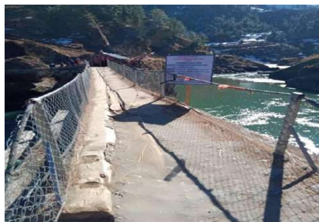
तातोपानी गाँउपालिका वडा नम्बर ४ र ५ जोड्ने ऐतिहासिक पुल निर्माण अघि र निर्माण सम्पन्न पछि काठे पुल