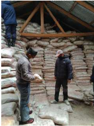
सिंजामा रहेको नुन गोदामको अनुगमन गर्दै

नेपाल सरकारले घोषणा गरेको Lockdown को अवधिमा अत्यावश्यक वस्तु तथा सेवाको आपूर्ति, औषधी, खाद्य वस्तु, दुध, तरकारी फलफूल जस्ता वस्तुको सहज व्यवस्थापनका सम्बन्धमा स्थानीय तहको नियमित बजार अनुगमनमा CCMC जुम्लाको सक्रिय सहभागिता रहने गरेको छ । कोभिड - १९ को संकटको बेला बजारमा हुनसक्ने कालोबजारीलाई नियन्त्रण गर्न जिल्ला प्रशासन कार्यालयको नेतृत्वमा उद्योग तथा उपभोक्ता हित संरक्षण कार्यालय, खाद्य प्रविधि तथा गुण नियन्त्रण डिभिजन कार्यालय, उद्योग वाणिज्य संघ, नागरिक समाज, पत्रकार महासंघ र सम्बन्धित स्थानीय तहहरूको सहकार्यमा नियमित अनुगमन गरिएको छ । जिल्ला कृषि विकास