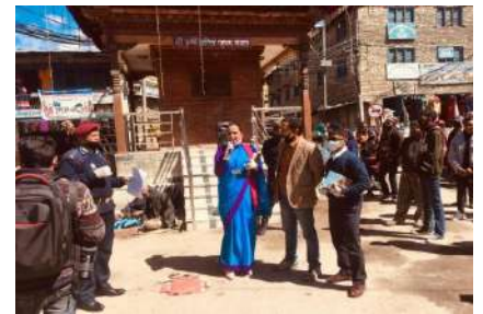
लकडाउनको माइकिड गर्दै प्र.जि.अ.

कोरोना भाइरस फैलने अवस्था सम्बन्धमा विभिन्न अन्तर्क्रिया कार्यक्रम, माइकिड, पोस्टर, पम्पलेट, फ्लेक्स प्रदर्शनी, स्वास्थ्यकर्मी मार्फत तथा स्थानीय रेडियो समेतको सहयोगमा सचेतना अभिवृद्धि गर्ने कार्य गरिएको छ । सावुन पानीले विधि सम्बत रूपमा हात धुने, व्यक्तिगत सरसफाईमा ध्यान दिने, माक्स लगाउने, कोरोना भाइरसका लक्षण देखिएमा नजिकको स्वास्थ्य संस्था वा चिकित्सकबाट सल्लाह लिने जस्ता विषयमा सूचना सम्प्रेषण गरिएको छ ।