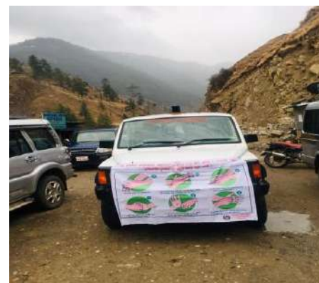
तयारी अवस्थामा Ambulance

कोरोना भाइस COIVD-19 को संक्रमणको उच्च जोखिमलाई मध्यनजर गर्दै COVID-19 Crisis Management Centre, जुम्लाको अनुरोध लाई स्वीकार गरी जुम्लाका प्रत्येक स्थानीय तहले बिरामीलाई ओसार पोसार गर्ने एम्बुलेन्स तथा सोही प्रकारको सवारी साधनको व्यवस्था गरेका छन्। यस्ता सवारी साधनले कतिपय स्थानीय तहमा क्वारेन्टाईन व्यवस्थापनमा समेत सहयोग पु-याएका छन्। यसै गरी कर्णाली स्वास्थ्य विज्ञान प्रतिष्ठानले COVID-19 Friendly Ambulance को व्यवस्था गरेको छ भने जिल्ला विपद् व्यवस्थापन समिति मार्फत त्यसै प्रकारको अर्को एक एम्बुलेन्स व्यवस्थापनको क्रममा रहेको छ।