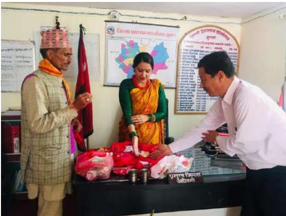
बडीमालिका पूजाका लागि वडिमालिका प्रस्थानको लागि प्रमुख जिल्ला अधिकारिको कार्यकक्षमा झोली पुजा गरिदै ।