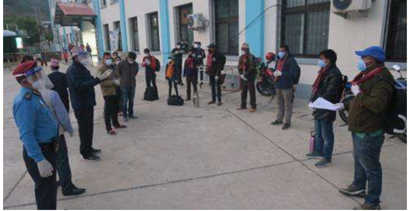
Isolation बाट घर फिर्ता भएका व्यक्तिहरू