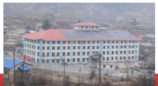
कर्णाली स्वास्थ्य विज्ञान प्रतिष्ठान, जुम्ला

जिल्ला स्तरीय एकीकृत क्वारेन्टाईन सेन्टर कर्णाली प्राविधिक शिक्षालयमा रहनु भएका दोस्रो चरणका २५ जना व्यक्तिहरूको PCR परीक्षण गर्दा २०७७/०२/१९ मा जुम्लामा प्रथम पटक १९ जनामा कोरोना संक्रमण