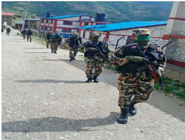
नियमित गस्तीमा नेपाली सेना

प्रदान गरेको छ । नेपाली सेना (नन्दा बक्स गण) ले नाम्मे हेल्थ डेस्कमा नियमित सुरक्षा सहजीकरण गर्नुका साथै Patient Receiving Team को महत्वपूर्ण सदस्यको रूपमा भूमिका निर्वाह गर्दै आइरहेको छ । राष्ट्रिय अनुसन्धान जुम्लाले COVID-19 सम्बन्धी सूचना संकलन गरी रणनीति निर्माणमा योगदान पु-याउदै आएको छ ।