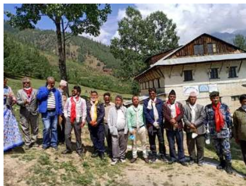
अनुगमनको क्रममा पातारासी गा.पा.मा प्र.जि.अ.ज्यू लगायत