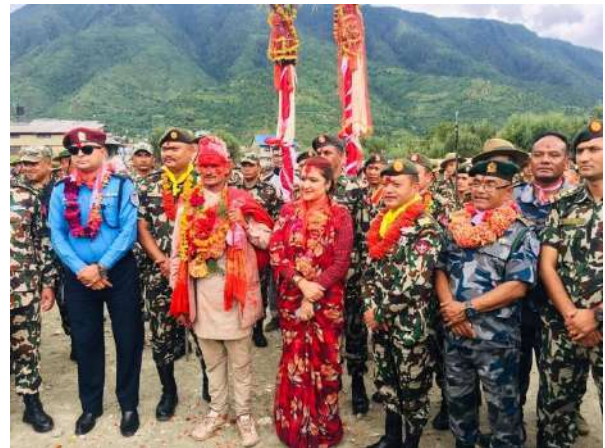
बडीमालिका पूजाबाट फर्के पछि टुडिखेलमा