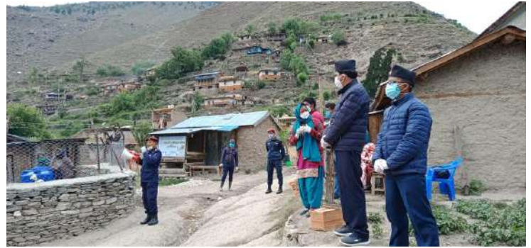
सरस्वती मा.वि. कुडारीमा प्र.जि.अ. सहितको टोली

। क्वारेन्टाईन स्थलमा भएको लजिस्टिक व्यवस्था, सुरक्षा