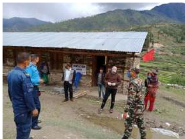
क्वारेन्टाइन स्थलको अनुगमनमा CCMC

बस्न अभिप्ररित गर्ने, स्थानीय तहसँग खानपान लगायत अन्य व्यवस्था चुस्त दुरूस्त राख्ने, स्वास्थ्य कर्मीलाई सुरक्षित रूपमा सेवा प्रदान गर्ने र स्थानीय हरूसँग यस संकटमा सरकारलाई सहयोग गर्न अनुरोध गर्ने गरेको छ ।