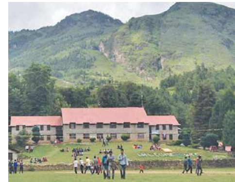
कर्णाली प्राविधिक शिक्षालय, घुघुती

यस अघि स्थानीय तह अन्तर्गत रहेका क्वारेन्टाईन सेन्टरमा बाहिरबाट आएका व्यक्तिहरू बस्न नमान्ने, जनप्रतिनिधिहरूसँग अनावश्यक वादविवाद, झै-झगडा गर्ने, क्वारेन्टाईन सेन्टरबाट भाग्ने, अनावश्यक माग राख्ने जस्ता व्यवस्थापकीय कठिनाईका कारण COVID-19 विरुद्धको अभियानलाई सशक्त बनाउनुका साथै जिल्लाको शान्ति सुरक्षालाई चुस्त दुरुस्त राख्न त्यस्तो कदम चालिएको थियो । यसरी जिल्ला प्रवेश गर्ने व्यक्तिहरूको संख्या बढे सँगसँगै तपशिल अनुसार एकीकृत क्वारेन्टाईन सेन्टरको स्थापना र सुरक्षाको व्यवस्था गरिएको थियो ।