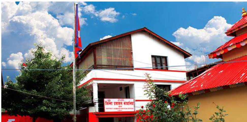
जिल्ला प्रशासन कार्यालय जुम्लाको कार्यालय भवन

स्थानीय प्रशासन ऐन २०२८ बमोजिम यस जिल्लाको शान्ति सुरक्षा, अमनचयन कायम गर्न तथा जिल्ला स्थित अन्य कार्यालयहरूसँग समन्वयकारी भूमिका निर्वाह गर्दै विकास तथा सुशासन प्रवर्द्धन गर्ने जिम्मेवारीका साथ निरन्तर रूपमा संचालन हुँदै आएको छ । मुख्यतया यस कार्यालयले नेपाल सरकार कार्यविभाजन नियमावली, २०७४ ले निर्दिष्ट गरेका