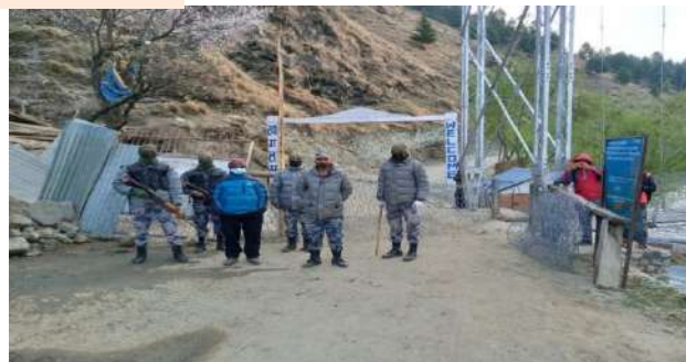
पोष्ट डिट्टी गर्दै सशस्त्र प्रहरी बल