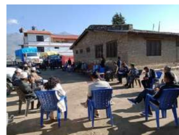
DDMC बैठकमा मा. नरेश भण्डारी

COVI-19 को रोकथाम र नियन्त्रणका क्रममा जिल्ला विपद् व्यवस्थापन समिति जुम्लाले १५ वटा बैठकको आयोजना गरेको छ । जस मध्य एउटा बैठकमा कर्णाली प्रदेश सरकारका मूख्य मन्त्री माननीय महेन्द्र बहादुर शाहीको समुपस्थिति रहेको थियो भने अर्को एक बैठकमा कर्णाली प्रदेश सरकारका आन्तरिक मामिला तथा कानून मन्त्री माननीय नरेश भण्डारीको समुपस्थिति रहेको थियो । जिल्ला सुरक्षा समिति ५० वटा, CCMC को २१ वटा, Command Post को ३ वटा र क्वारेन्टाइन संचालन तथा व्यवस्थापन समितिको ११ वटा