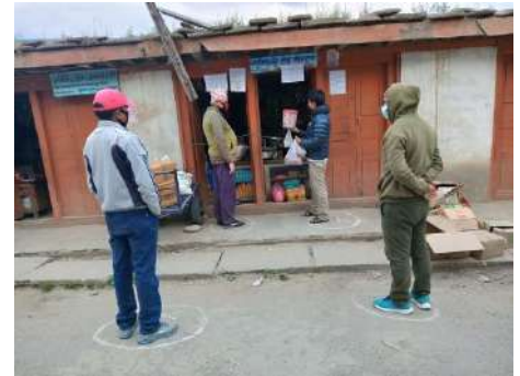
सामाजिक दुरी कायम गर्दै किनमेल

कार्यालय, नेपाल खाद्य तथा व्यापार कम्पनि लिमिटेड र उद्योग बाणिज्य संघ, जुम्लालाई कम्तिमा ३ महिनाका लागि पुग्ने गरी खाद्यन्न मौज्जात राख्न निर्देशन दिनुका साथै आम उपभोक्ताहरूमा ग्याँसको अभाव हुन नदिन जिल्ला भित्रका ग्याँस बिक्रेताहरूसँग निरन्तर समन्वय गरी बजारमा प्रयाप्त मात्रामा ग्याँसको व्यवस्था गरिएको छ । यसै गरी अत्यावश्यक सेवामा संचालित सवारी साधनहरूलाई ईन्धनको अभाव हुन नदिन प्रयाप्त मात्रामा ईन्धनको मौज्जात राख्न ईन्धन व्यवसायीहरूलाई निर्देशन दिईएको छ । कोरोना भाईरस (COVID-19) को संक्रमण, रोकथाम, नियन्त्रण तथा प्रतिकार्यको लागि गरिएको Lockdown (बन्दावन्दी) को कारण साना किसान, मजदुर तथा उपभोक्ताहरूमा पर्न जाने असरलाई मध्यनजर गरी प्रथम चरणमा उद्योग बाणिज्य संघ, जुम्लाको समन्वय तथा सहकार्यमा स्थानीय बजार तथा पसलहरू बिहान ७ बजे देखि ९ बजे सम्म र बेलुका ४ बजे देखि ६ बजे सम्म लकडाउनको न्यूनतम शर्त पालना गर्ने गरी दैनिक उपभोग्य वस्तुहरू खाद्यान्न, तरकारी, दुध र फलफूल लगायतका सेवाको बिक्री वितरणका लागि खुल्ला गरिएकोमा जुम्ला जिल्लामा कोरोना संक्रमित घट्टेसँगै दोस्रो चरणमा स्थानीय बजार बिहान ६ देखि दिउँसो ४ बजे सम्मका लागि खुल्ला गरिएको छ ।