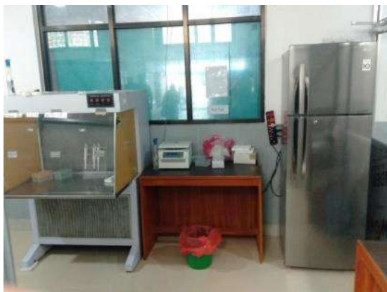
PCR उपकरणबाट परीक्षण गरिदै ।