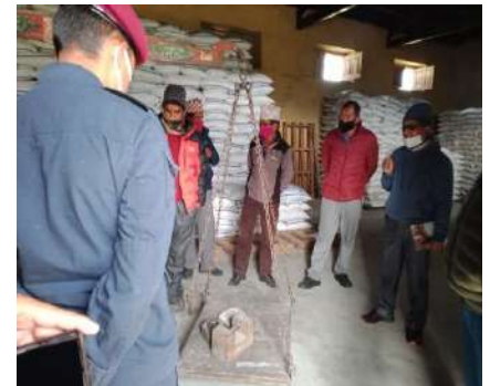
खाद्य गोदाममा चामलको परिमाण जाँच गर्दै